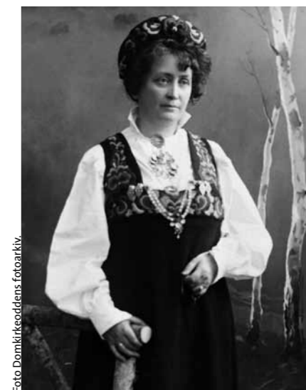
Hulda Garborg (1862-1934)

De to første klubbmøtene har vært sentrert om samme tekst: «Kvinderne og Samfundet». Dette er en tale som Hulda Garborg holdt ved to anledninger i 1915, i Oslo og Trondheim. I talen fremlegger Garborg sitt syn på kvinnesaken og ser den i sammenheng med en mer generell teori om menneskesamfunnenes utvikling. Garborg har ofte, nesten til