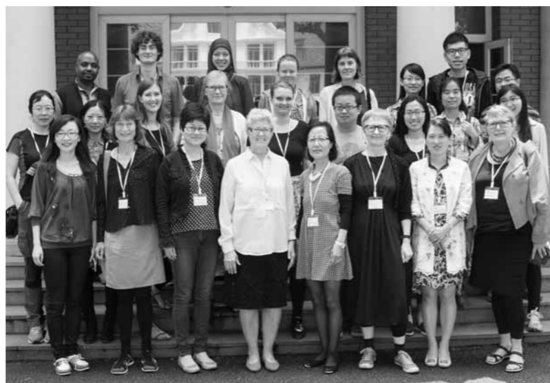
Deltakerne på ph.d.-kurset var kinesere fra Kina, kinesere fra Norden/Vesten, nordiske folk fra Kina og nordiske folk fra Norden.

På kursprogrammet sto forelesninger om vestlige og kinesiske moderniseringsprosesser spesielt med henblikk på den unge generasjonen, den nye middelklassen og feminisme i Kina. I alt ti kinesiske, danske og norske lærere foreleste og kommenterte på prosjektfremleggelse. Tyve av de 25 deltakere benyttet anledningen til å legge frem sine pågående prosjekter – som handlet om alt fra barneoppdragelse i tre generasjoner, ettbarnspolitikkenes konsekvenser for eldreomsorg, vietnam-