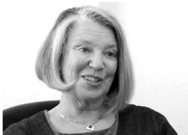
Nancy Fraser er professor i statsvitenskap og samfunnsfag med stor vitenskapelig produksjon av bøker og artikler. Hun har vunnet en rekke priser og har vært gjesteforsker ved mange universiteter, også i Europa.

Salen var fylt til randen av tilhørere, ikke bare av kjønnsforskere, men fra flere fagfelt. Hva betyr det at kvinnelige migranter tar over omsorgsoppgaver for utarbeidende middelklassekvinner? spør Fraser. Hva skjer når omsorg blir